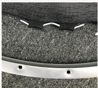
①ネットにネットフックを付けた状態から始めます