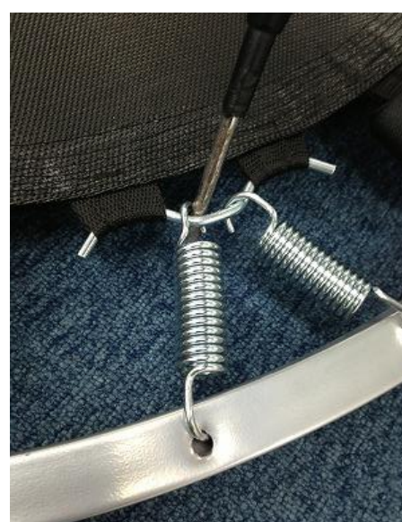
③スプリングが取り付けられます