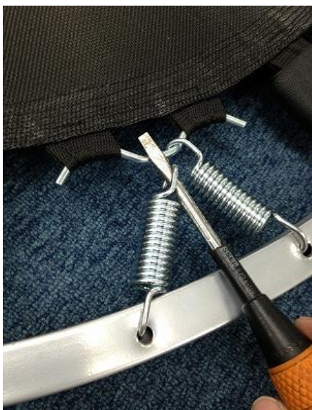
①ドライバーを内側から外側に通します。