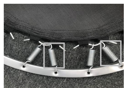
③1本飛ばして1周スプリングを取り付けたら、もう一方のスプリングも順番に1周取り付けます。