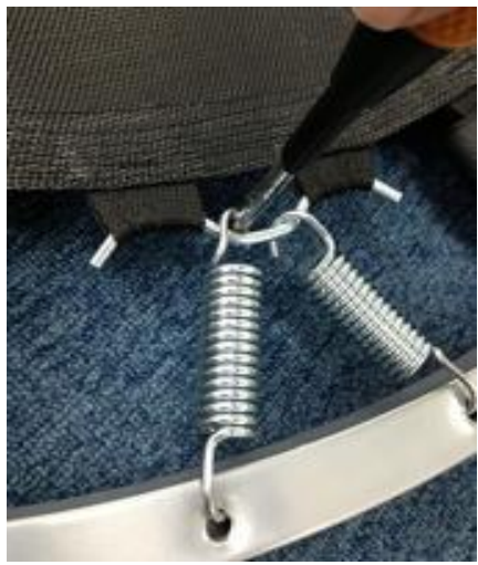
⑤ドライバーを左に回転させる