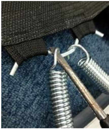
②ドライバーの先端をフックに引っかけます