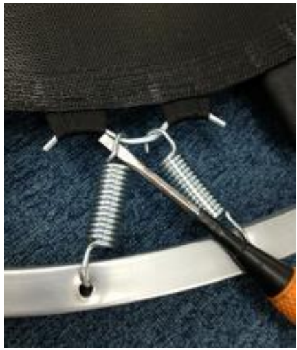
①ドライバーを内側から外側に通します。