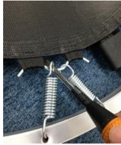
③ドライバーを奥へ押し込みます