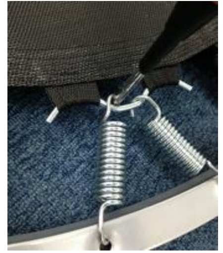
④ドライバーを90°立てるイメージ