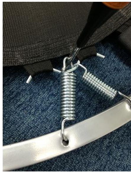
②ドライバー持ち手を上に上げていきます（90°位上げれば取り付けられます）