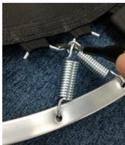
⑥スプリングが外れます